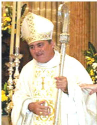
D. José Mazuelos en el día de su ordenación episcopal.